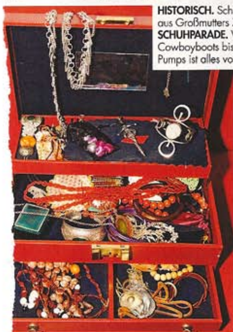
HISTORISCH. Schmucke Kleinode aus Großmutter's Zeiten ... (links). SCHUHPARADE. Von lässigen Cowboyboots bis zu eleganten Pumps ist alles vorhanden.